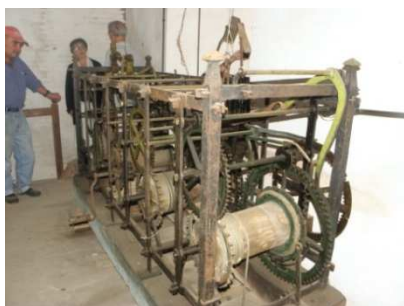
Visite de l'horloge Mayet de la collégiale de Salins